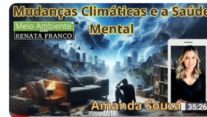
Como as mudanças climáticas afetam a saúde mental